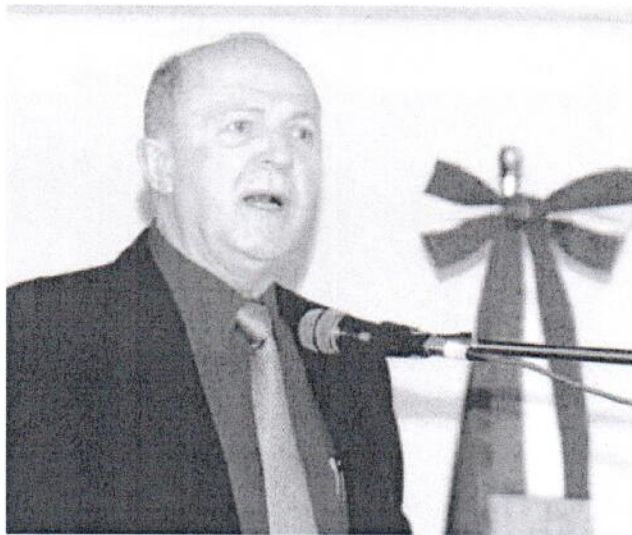
DISCURSO. El vicerrector de UdeG citó que la educación de calidad es una de las prioridades

"Resulta que se emite un programa y planes de estudio y los reglamentos operan sólo a nivel de centro, entonces ¿qué pasa cuando en diez centros se imparte la licenciatura en Derecho?, ¿quién promueve los cambios?", cuestionó la