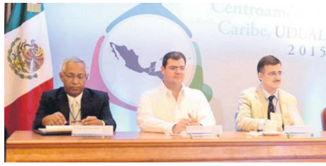
La reunión de la UDUAL se realizó el 12 y 20 de noviembre en Veracruz.